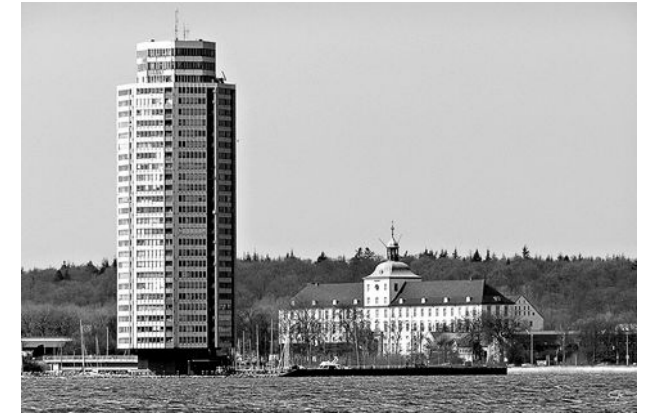
Wikingturm + Schloss Gottorf